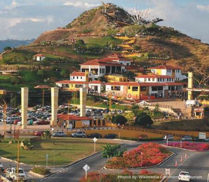
Parque Nacional Chicamocha