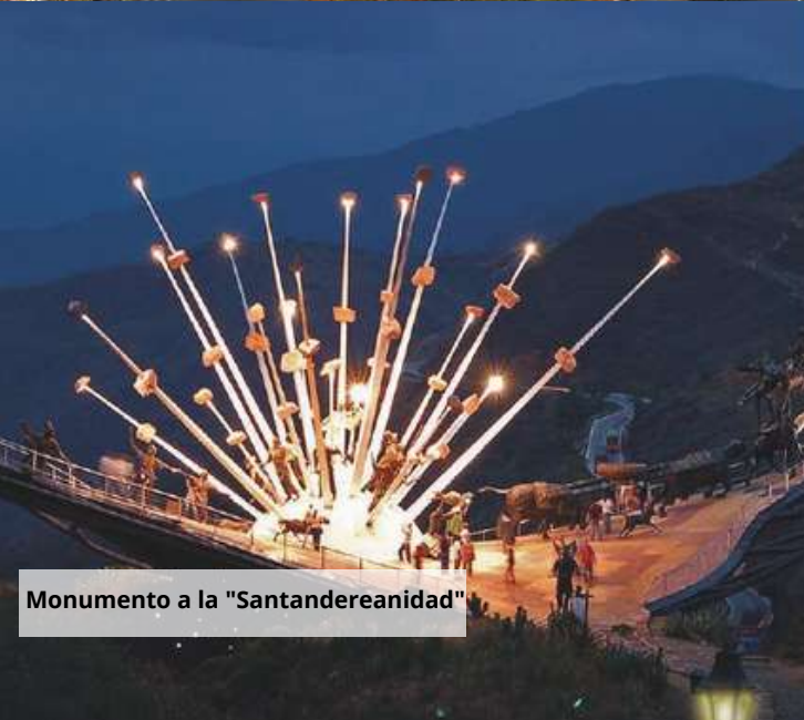
Monumento a la "Santandereanidad"